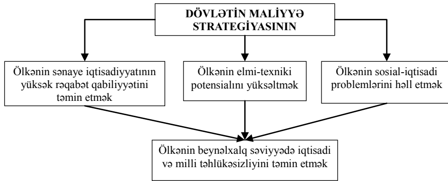
Şəkil 2. Dövlətin maliyyə strategiyasının məqsədi.

Maliyyə strategiyasının dövlət tərəfindən yaradılması və icra edilməsinin əsas məqsədləri şəkil 2-də öz əksini tapmışdır.